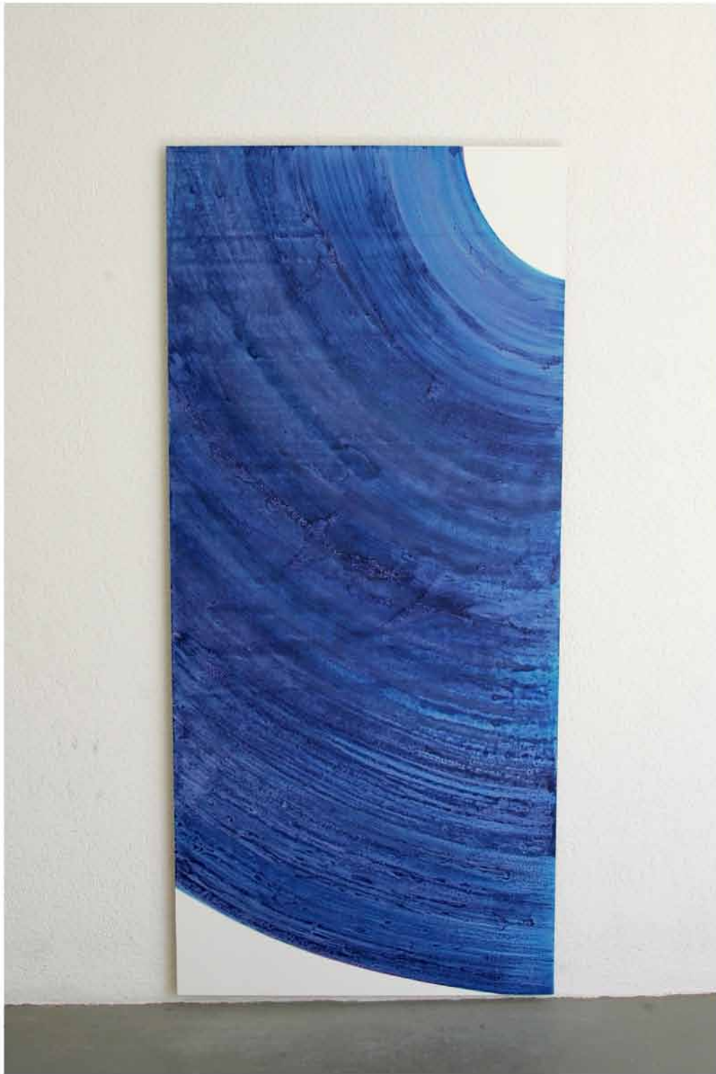
Fragment , 2005 encre, panneau 180x80cm