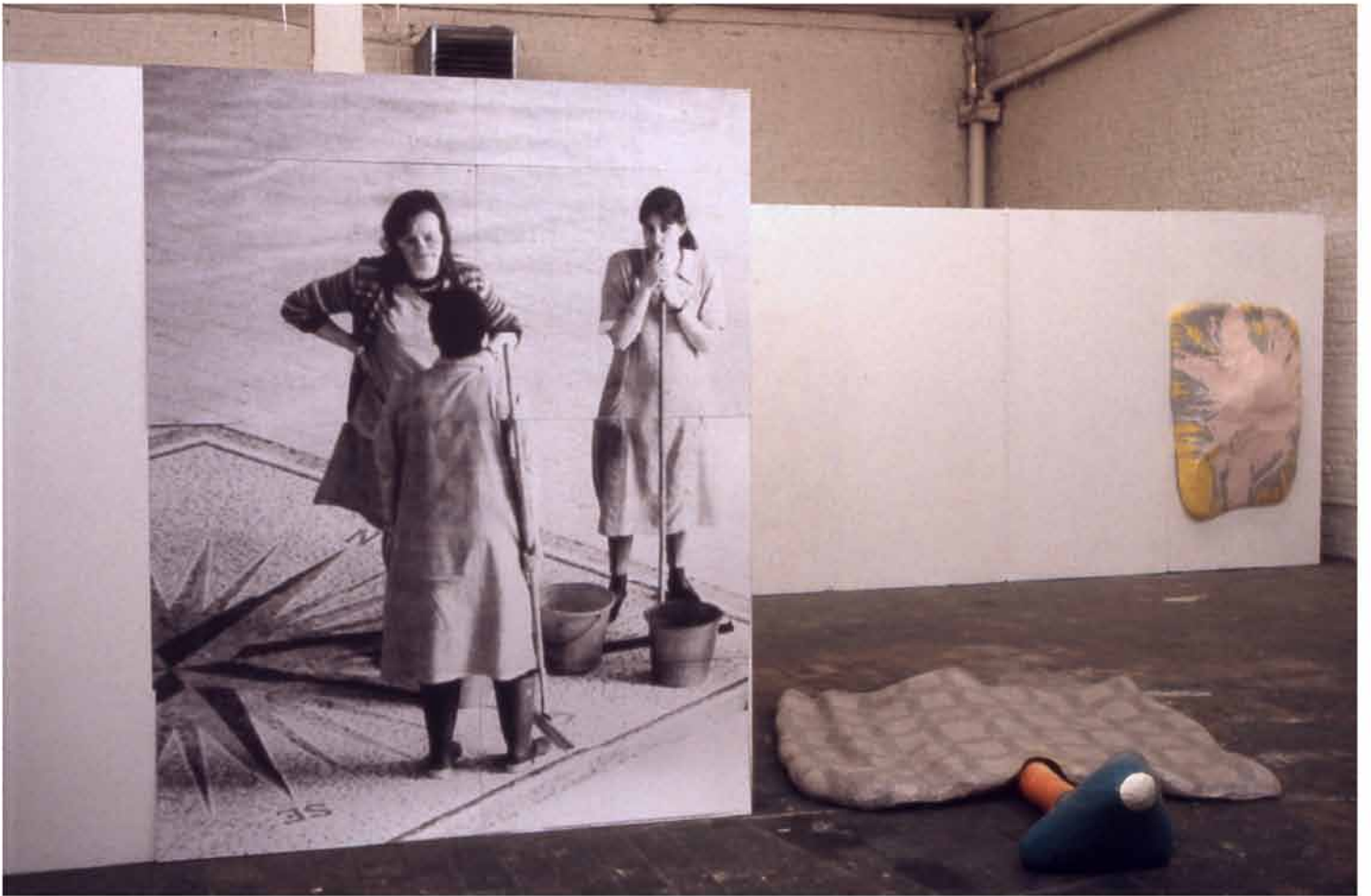
La pause, 2000 300x280cm photocopies