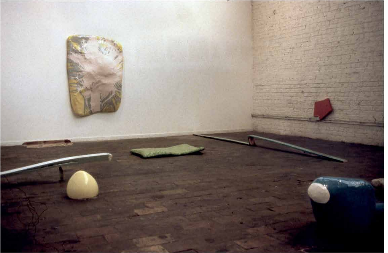
vue d'exposition, 2001