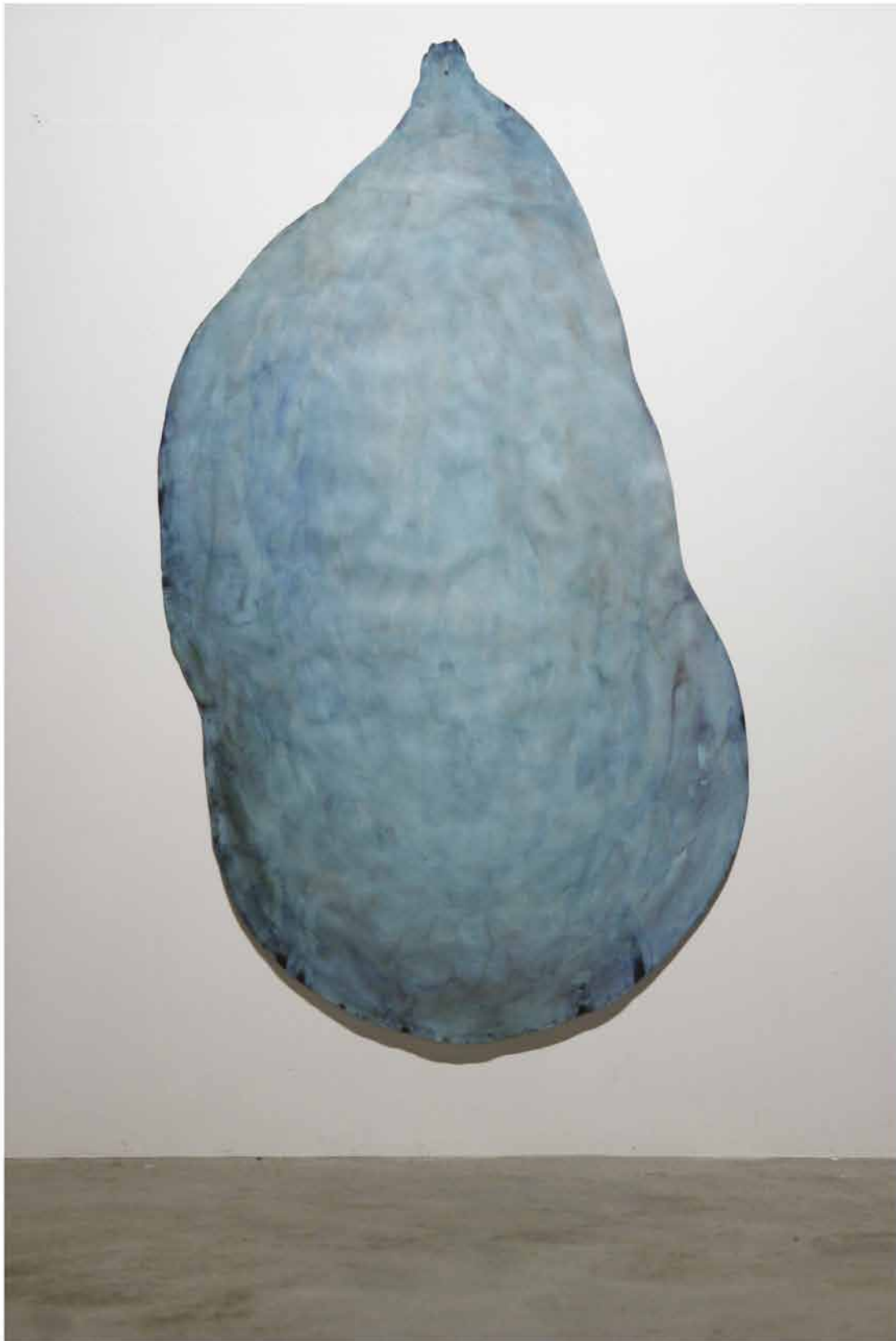
Série: Flaque , 2003 180x120cm aquarelle, vernis sur papier