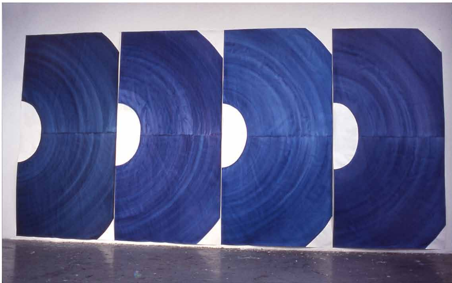
Entre chien et loup , 2004 (4x)330x150cm encre, vernis sur papier