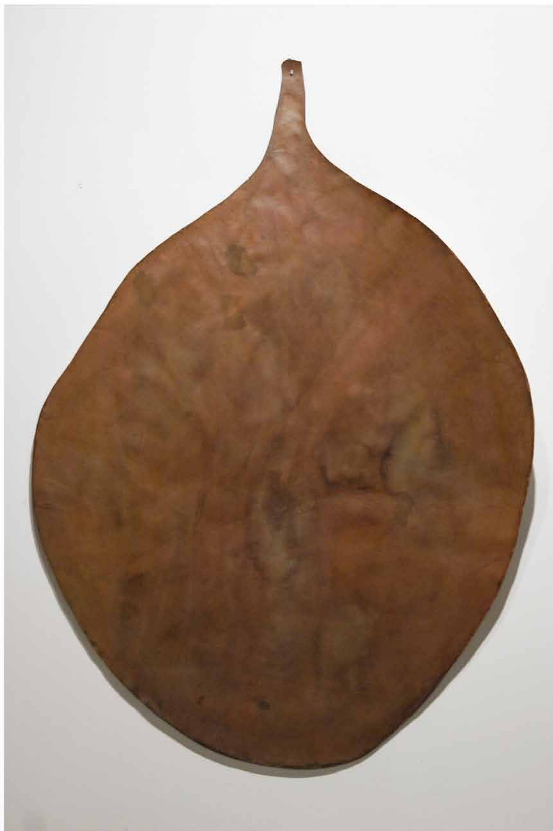
Série: Flaque , 2003 180x150cm aquarelle, vernis sur papier