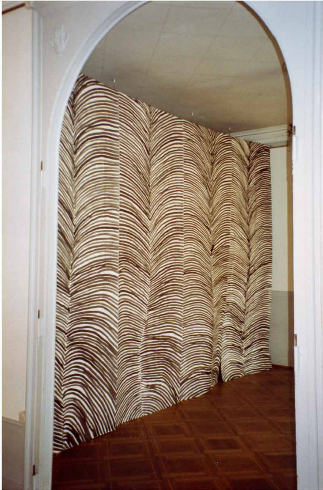
Entraçage , 2005 (4x)320x140cm encre sur papier