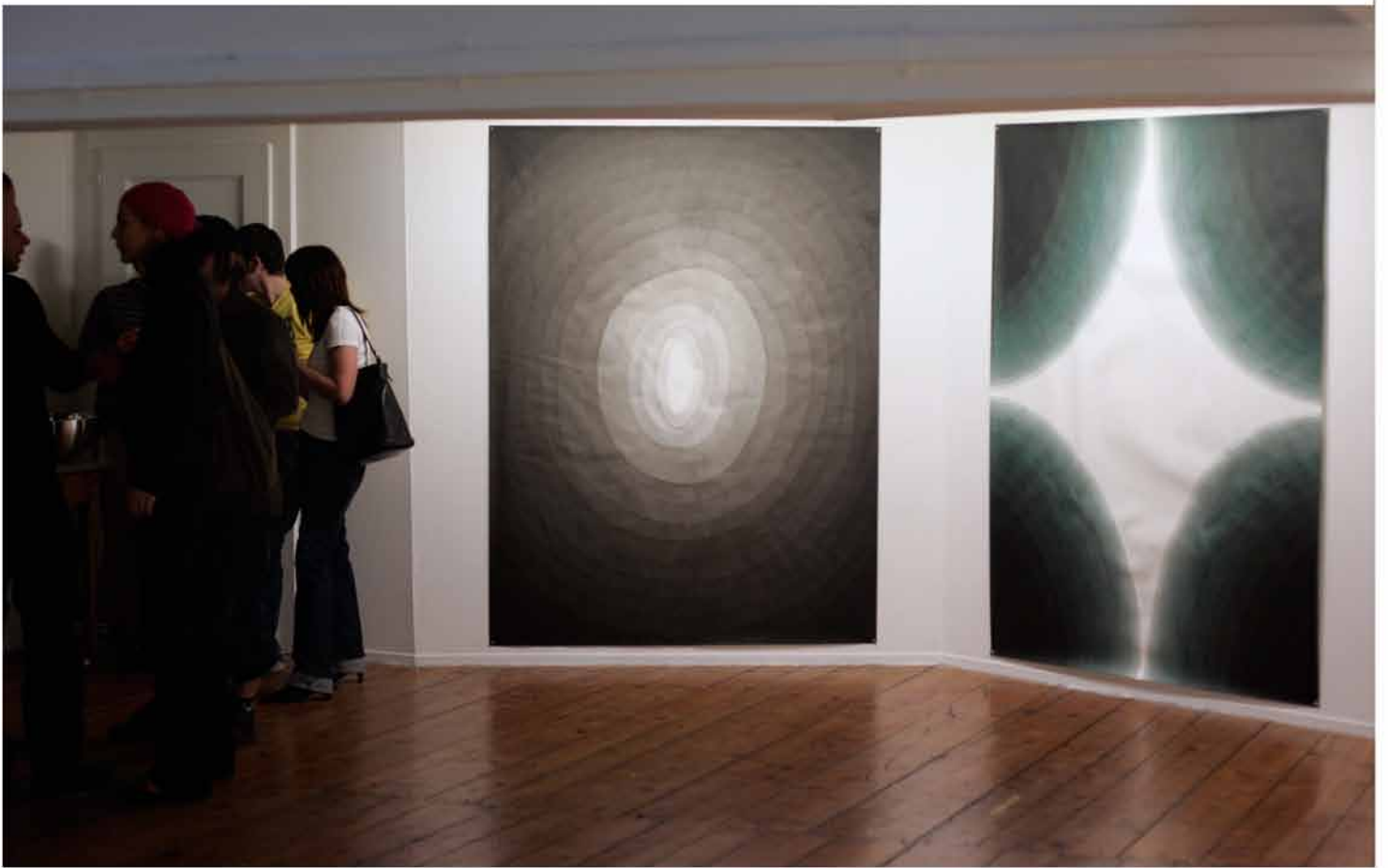
vue de l'exposition: Passage secret, 2006