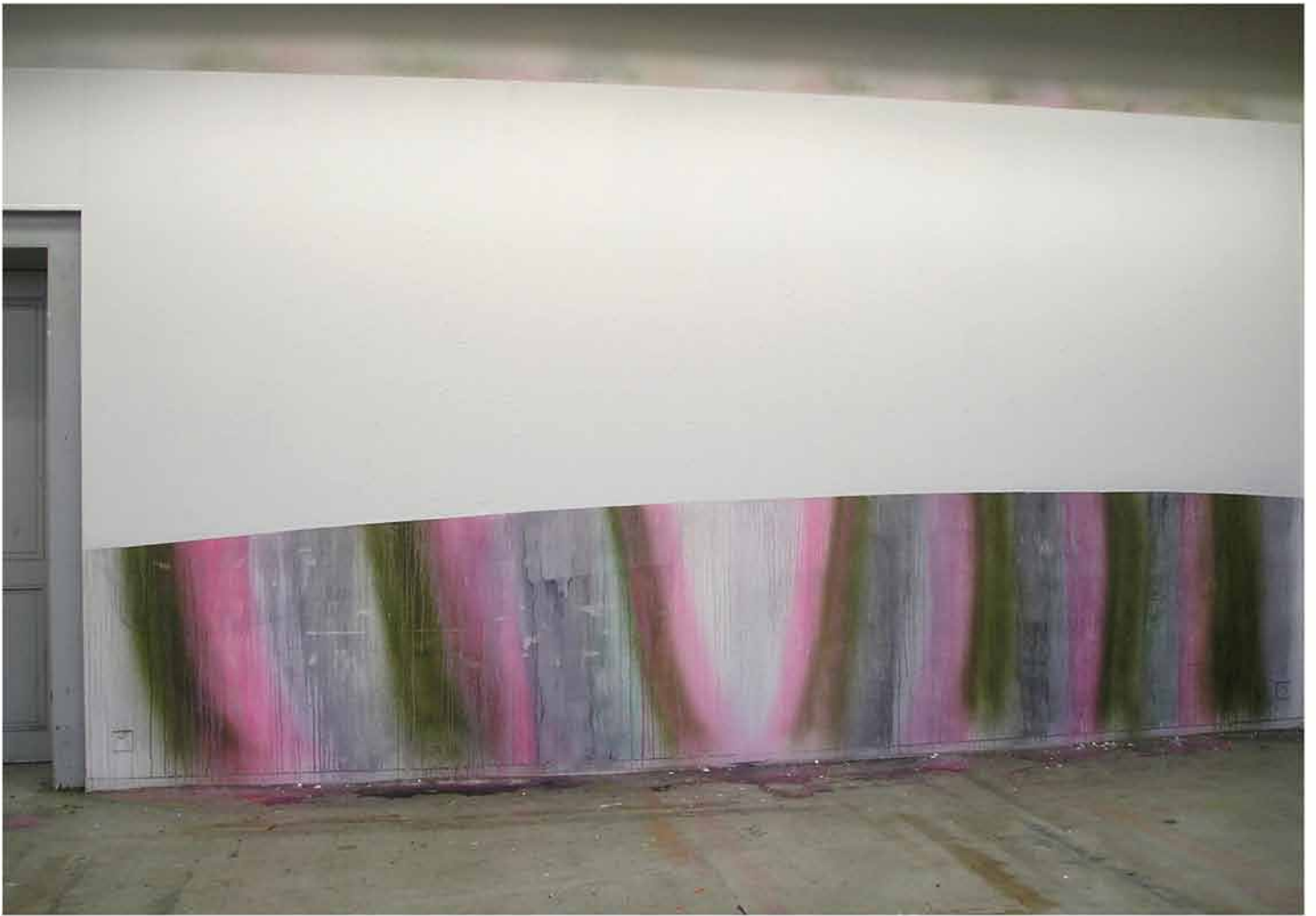
Sans titre , 2004 300x800cm aquarelle, encre sur mur