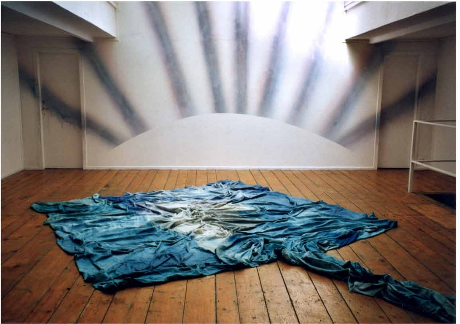
vue de l'exposition: Passage secret, 2006