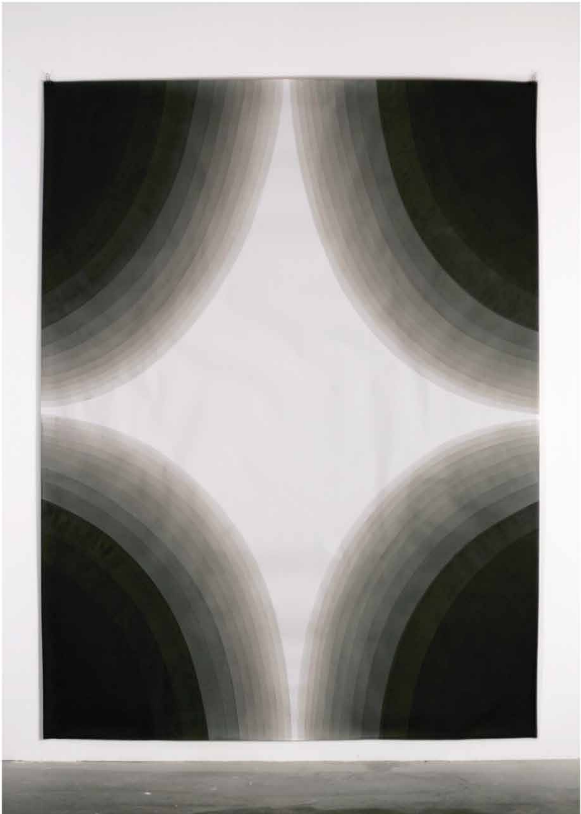
série: Lavis, 2006 200x150cm encre de chine sur papier