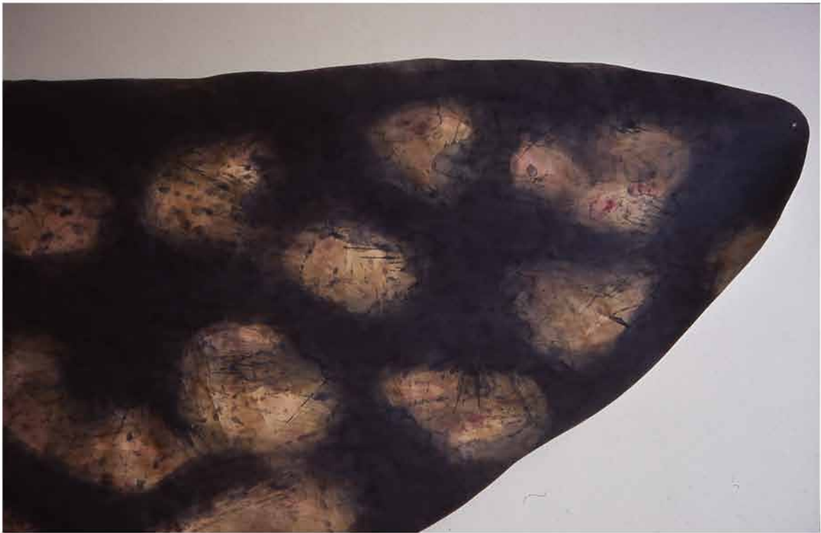
Pourriture , 2004 150x700cm encres sur papier