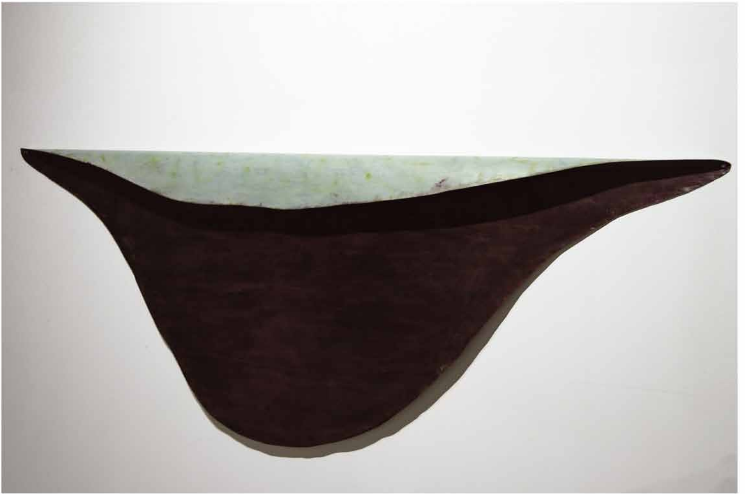
Le pli , 2003 150x300cm encre, vernis sur papier