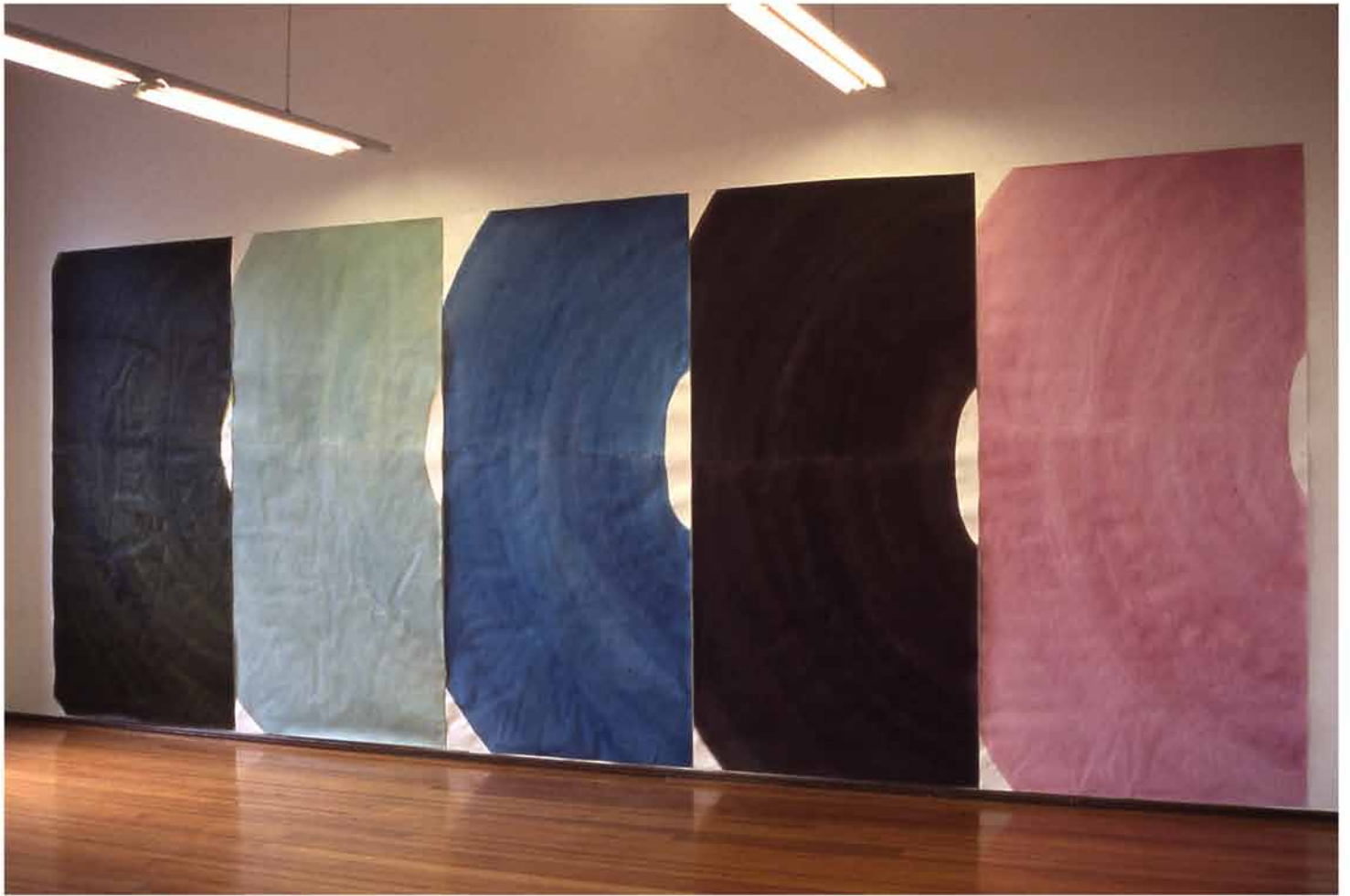
Aquarelles , 2005 (5x)330x150cm aquarelle, vernis sur papier