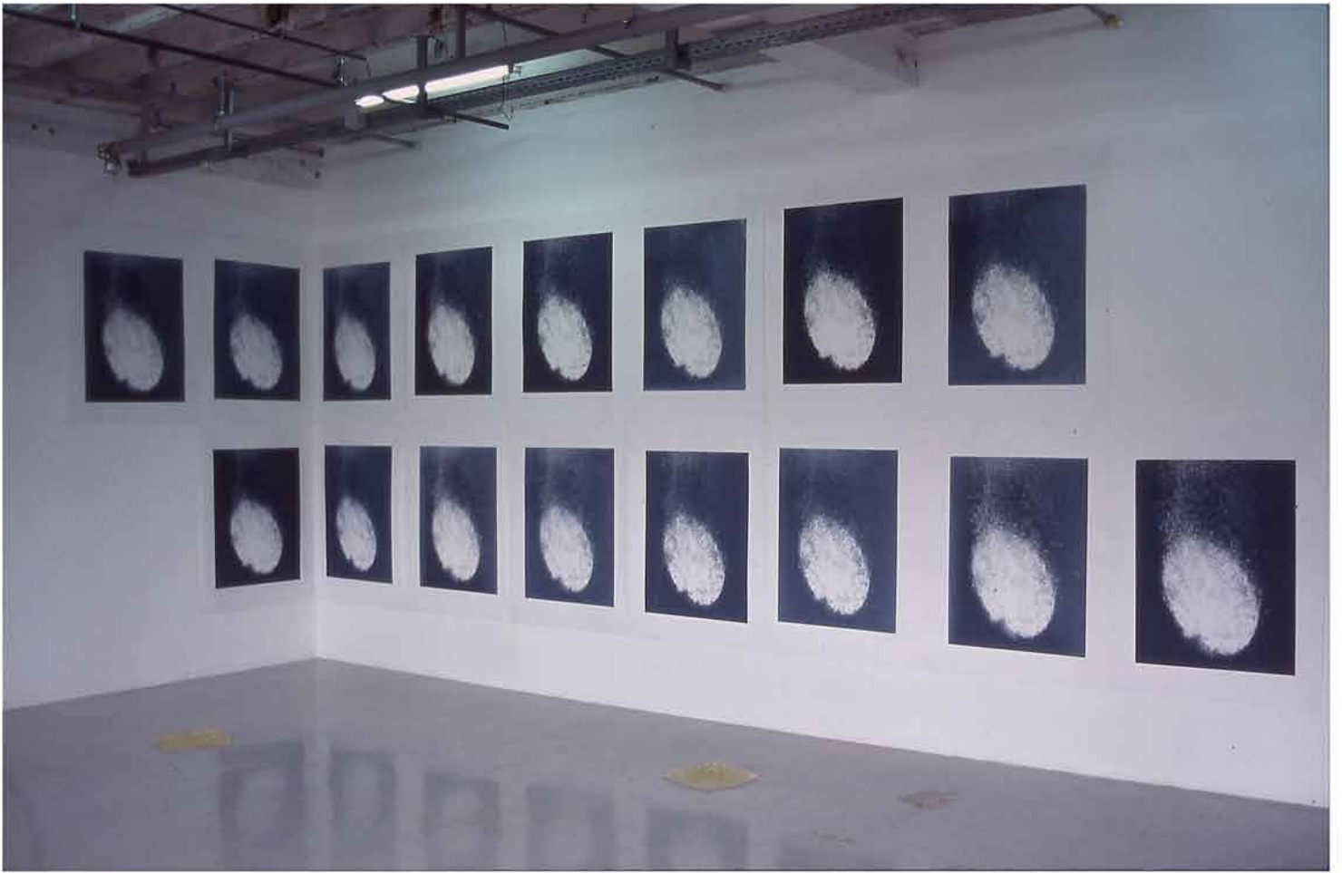
Effervescence (ou maux de tête), 2004 sérigraphie sur papier