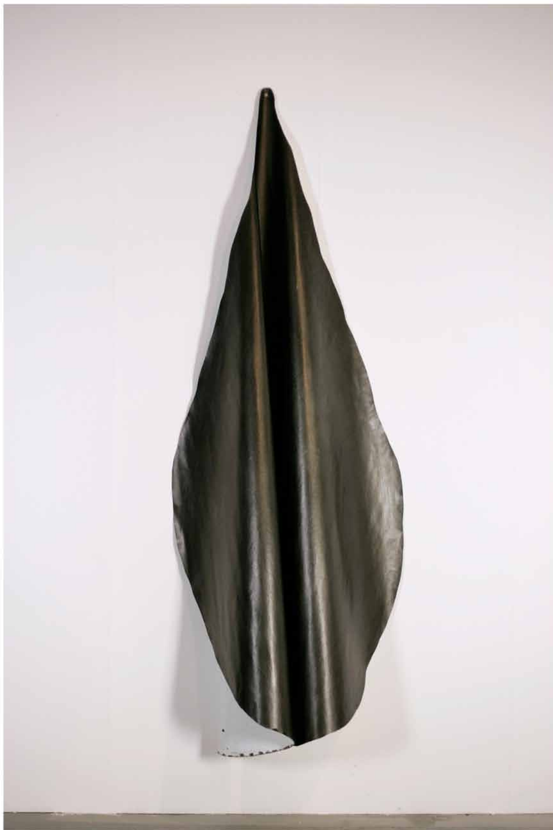
Enveloppe , 2006 200cm x dimensions variables acrylique sur papier