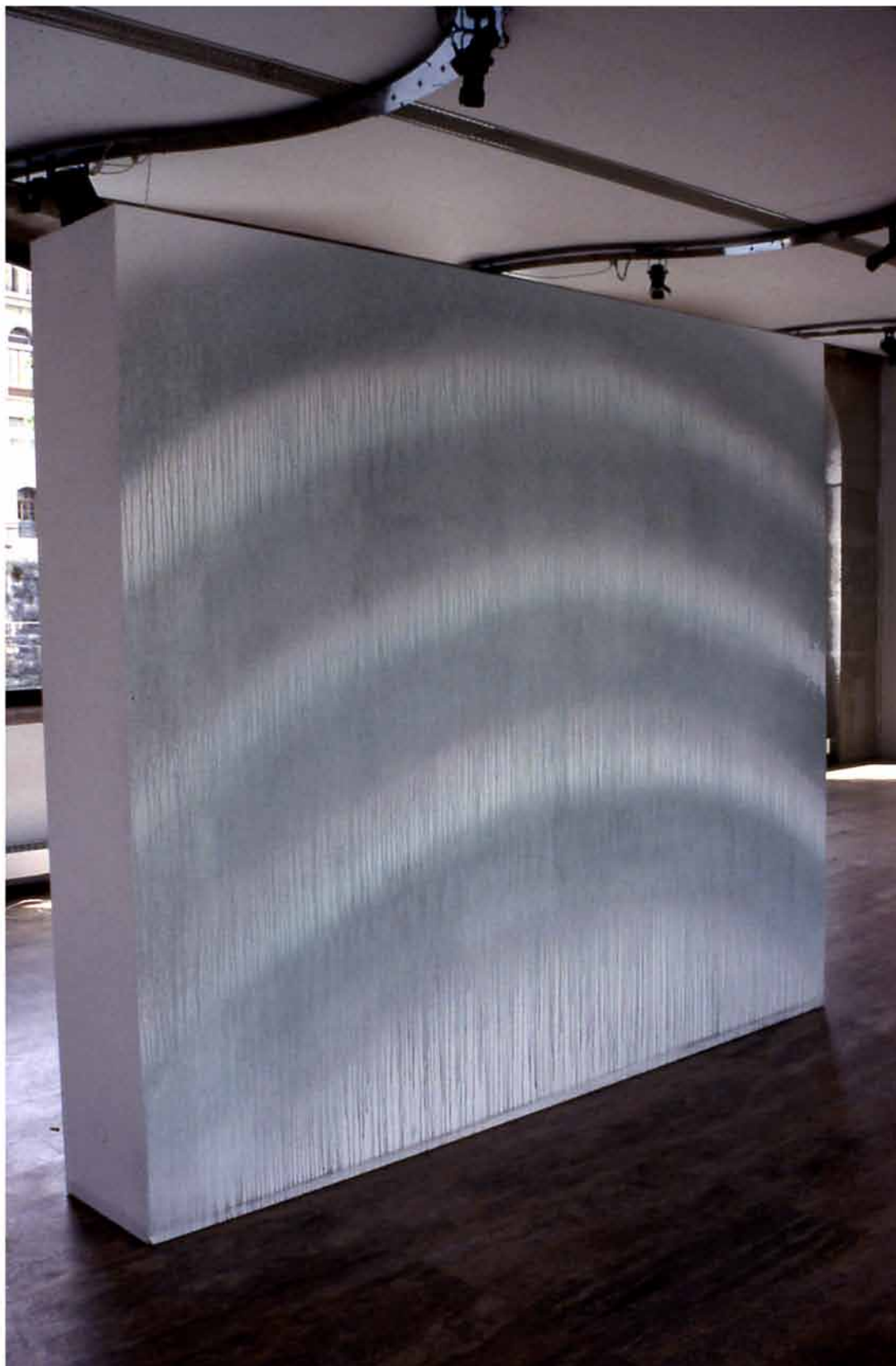
Ondes , 2005 280x300cm aquarelle sur mur